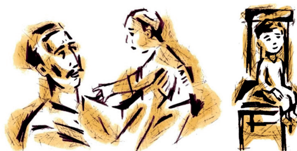
2-rasm. "Hayot daryosi" multfilmi.