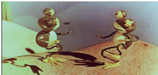
1-rasm. "6x6 kvadratida" multfilmidan lavha.