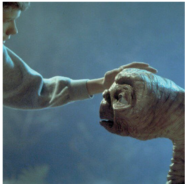
“O’zga sayyoralik” filmi (Rej. S. Spilberg)

1960–1990-yillarga kelib mamlakatda asosan ertak filmlar yaratildi. Ushbu filmlar dramaturgiyasidan ko’zlangan asosiy maqsad