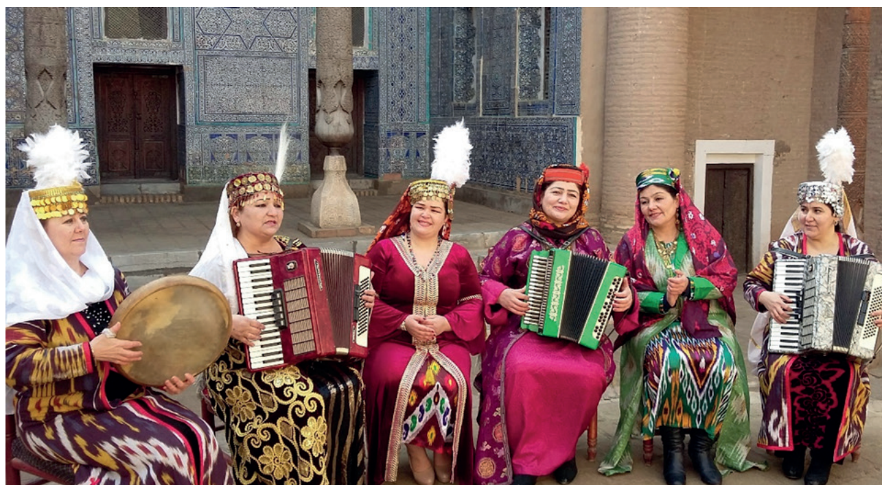
“Xiva xalfalari” folklor jamoasi, 2023-yil.

Keywords: khalfa, epic, creativity, performance, instrument, song, tradition