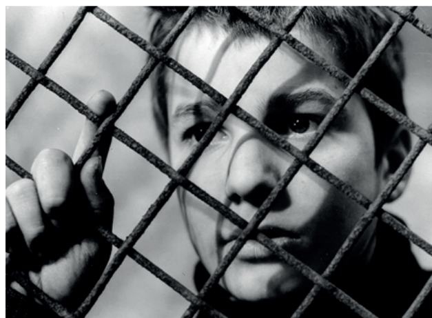
“400 zarba” filmi (Rej. F. Tryuffo)

30-yillarga kelib Uolt Disney kompaniyasi ishlab chiqargan mahsulotlar Qo’shma Shtatlardagi yetakchi bolalar va oilaviy filmlar qatoriga kirdi. Ikkinchi jahon urushidan oldin studiya aka-uka Grimm ertaklari asosida dastlab “Oppog’oy va yetti gnom” (1937) animatsiyasini yaratish orqali kelajakda bolalar filmlari samaradorligiga asos bo’ladigan qadamni tashladi. Ikkinchi jahon urishi